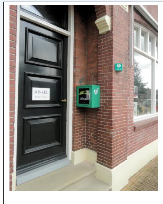
De AED heeft een plek gekregen waar iedereen bij kan zo dat nodig is. Nu nog even registreren.

Het was vakantie, maar dat wil niet zeggen dat alle leden van de Vrijloop vrij hadden. Zo moest Miks Welzijn het gebouw aan de Brugstraat ontruimen. En de Vrijloop heeft voor heel weinig heel wat inventaris over kunnen nemen. Dat moest allemaal wel getransporteerd worden. Daar zijn onze "hulptroepen" voor ingeschakeld. En er moest ook geklust worden. Elektrisch vernieuwen, plafond verbouwen, winkelinventaris aanpassen en nog veel meer. Een woord van dank aan alle vrijwilligers is hier wel op z'n plaats.