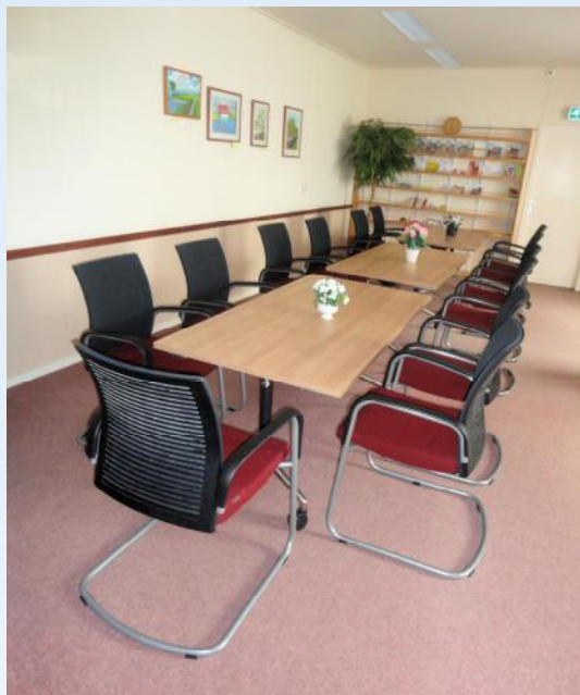
Facelift voor de "Versus" zaal.